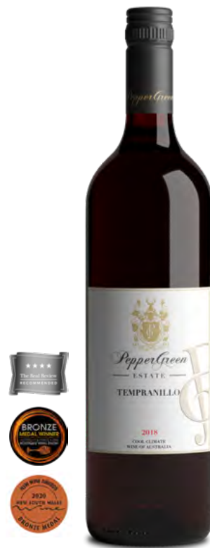
2018田帕尼優紅葡萄酒 涼爽氣候區精選

酒色呈現深紅酒色，邊緣有石榴石的色澤。帶有甜李子的香氣。酒體飽滿。口感誘人且有成熟的李子味。酒體酸度均衡。