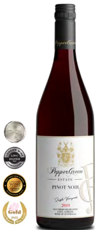
2019黑皮諾紅葡萄酒 單一葡萄園系列