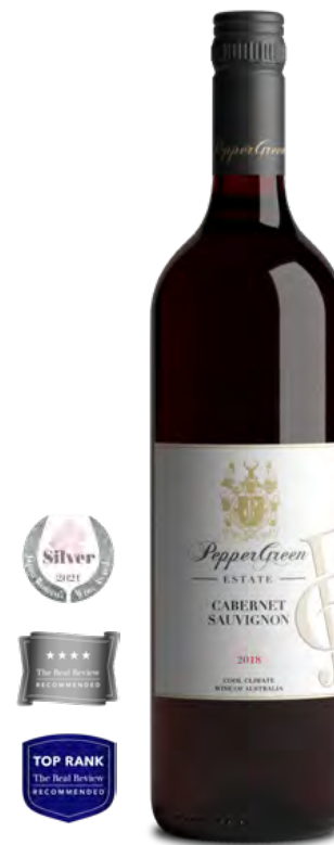
2018 卡本內蘇維翁紅葡萄酒 涼爽氣候區精選

酒色略帶紫色偏中等紅的色澤，帶有紫羅蘭、紅莓和綠葉的色調。香氣濃郁。中等酒體。優雅的莓子風味，並帶有細微單寧感。