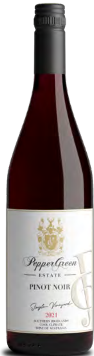
2021黑皮諾紅葡萄酒 單一葡萄園系列

帶有出色的蘋果紅的色澤，並散發出帶有成熟的紅色水果的淡雅香氣，溫和順口精緻的黑皮諾，有著微微的單寧並帶有香料味、黑櫻桃和莓子的特殊口感。餘味悠長，口中環繞的多變香氣。