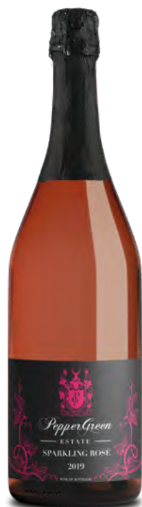
2019澳翠莊園玫瑰氣泡葡萄酒 單一葡萄園系列